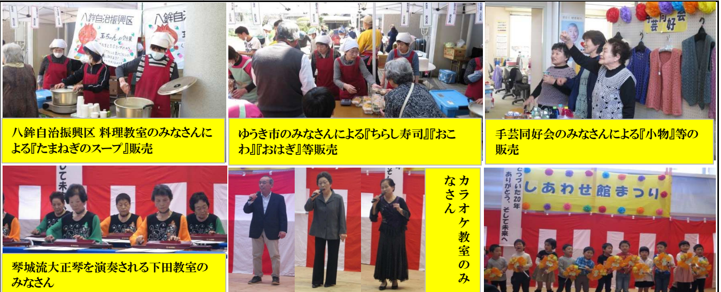
八銚自治振興区 料理教室のみなさんによる『たまねぎのスープ』販売