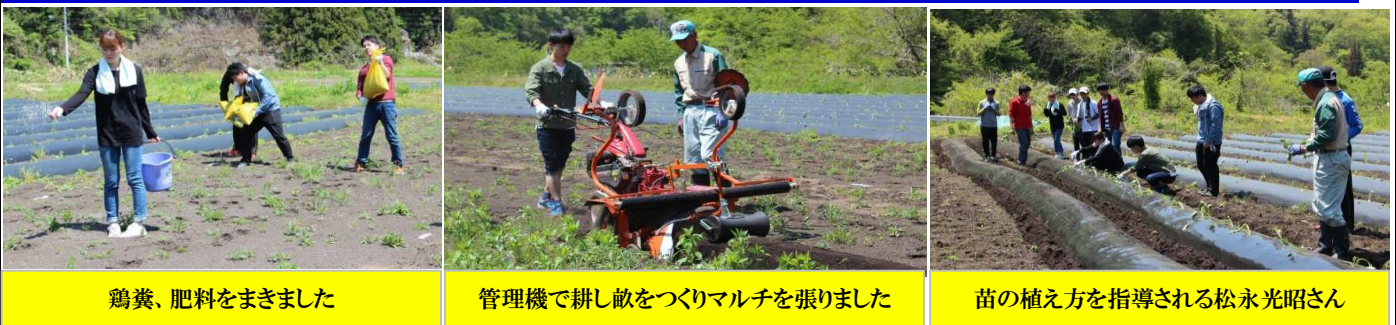
鶏糞、肥料をまきました