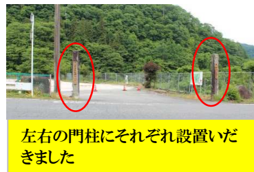
左右の門柱にそれぞれ設置いただきました