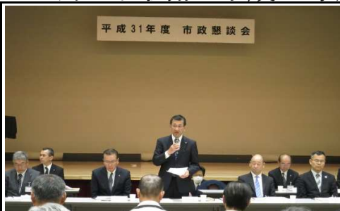
木山市長より開会の挨拶