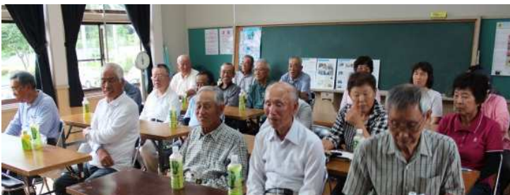
参加者19名のみなさんは熱心に耳を傾けておられました

最後に、モノがあっても幸せにはなれず、みんなが幸せになるには地域共生社会、福祉文化を築くことが大切であると締めくくられました。