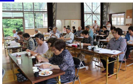
簡単にできるレシピの試食

一般介護予防事業として、今年も庄原市社会福祉協議会による「健康寿命向上セミナー」がスタートしました。