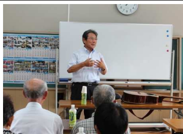
ご経験談を幅広くご説明