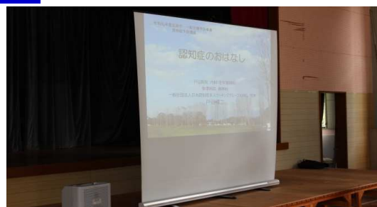
パワーポイントを使用して「認知症のおはなし」