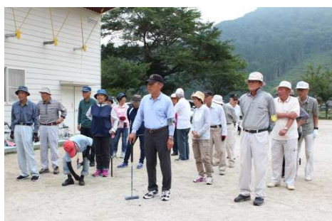
総勢20名のみなさんが勢ぞろい