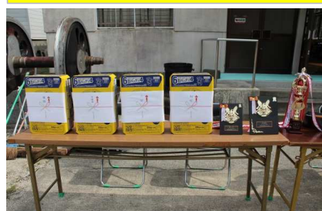
豪華賞品をご用意いたしました

好天に恵まれ残暑の厳しい日でしたが、楽しいひと時を過ごすことができました。 参加者のみなさんは勿論、大会を準備いただきました高齢者部のみなさん、ありがとうございました。