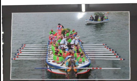
抜群の角度で撮影 ※一糸乱れぬ櫂かきの動きがバッチリ

前回「絵手紙サロン」の作品に続き、今回“菩提淀道さん”撮影「ホーランエンヤ渡御祭」を6点展示させてもらっています。