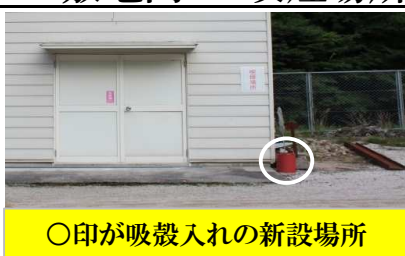
○印が吸殻入れの新設場所

健康増進法の一部改正が7月公布され、受動喫煙防止対策が強化されることから「喫煙場所を変更」しました。従来、校舎正面玄関、体育館出入口の2ヶ所設置していましたが、いずれも撤去し幼稚会建物の角1ヶ所としました。ご理解とご協力をお願いします。