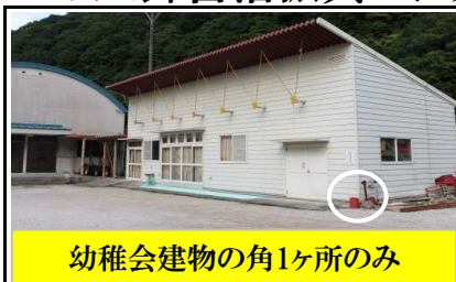
幼稚会建物の角1ヶ所のみ