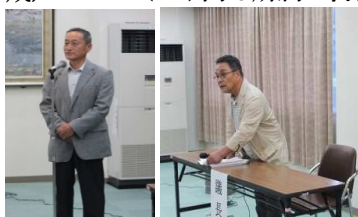
藤崎議長によりスムーズに進行