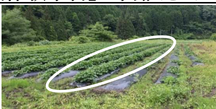
7月5日現在の生育状態

5月11日学生14名で苗植えを行ったサツマイモが、順調に生育しております。7月27日は学生18名が来訪し「星空映画館」を鑑賞、当振興センターへ1泊、翌日中間手入れを実施。 ※農業体験に使用している苗は左写真の○印部分です。