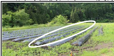
6月12日現在の生育状態