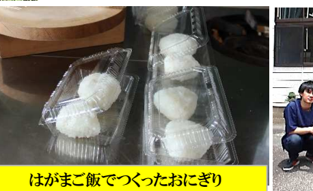
はがまご飯でつくったおにぎり