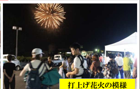
打上げ花火の様様