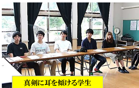
真剣に耳を傾ける学生