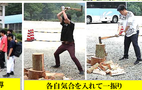
各自気合を入れて一振り