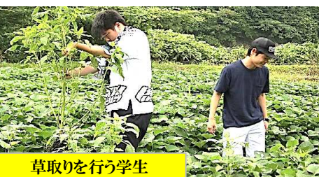
草取りを行う学生