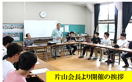
片山会長より開催の挨拶

食後はクロカンパークで「星空映画館」「花火」を鑑賞、その後男子は当振興センターへ、女子は安原旅館へ宿泊しました。