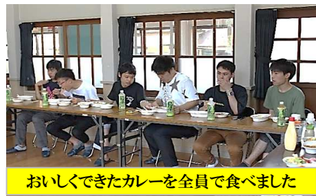
おいしくできたカレーを全員で食べました