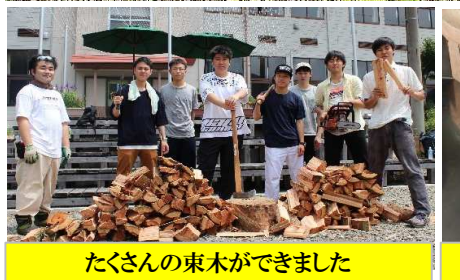
たくさんの東木ができました