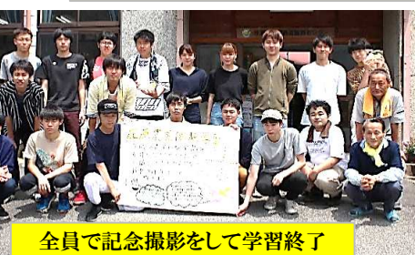
全員で記念撮影をして学習終了