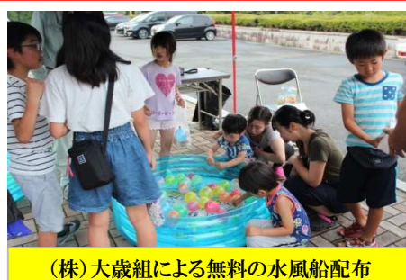
(株)大歳組による無料の水風船配布