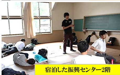
宿泊した振興センター2階