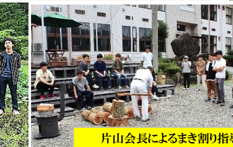
片山会長によるまき割り指導