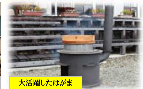
大活躍したはがま