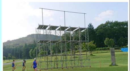
今回活躍の場がなく、寂しくそびえ立つ巨大スクリーンの特設台