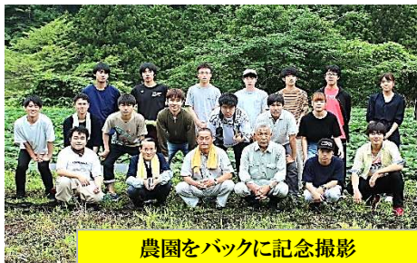
農園をバックに記念撮影