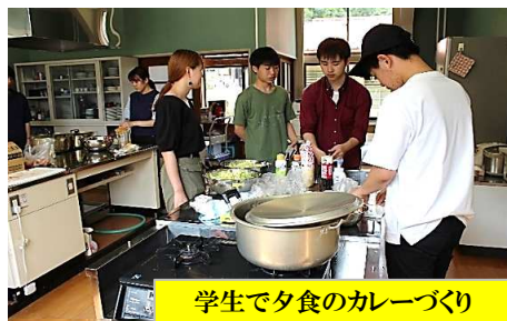
学生で夕食のカレーづくり