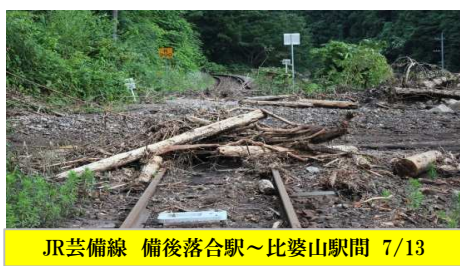
JR芸備線 備後落合駅～比婆山駅間 7/13

現在、行政をはじめ関係機関が一体となり、被害に遭われた方への対応、被災地の復旧等行っておられ、主要道路においては短期間で支障のない程度に回復されているようです。一方、被災箇所が多いため、細部に亘っては今しばらく時間がかかるものではないかと推察されます。