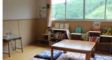
ラウンジへ設置のこたつ、絨毯、座布団