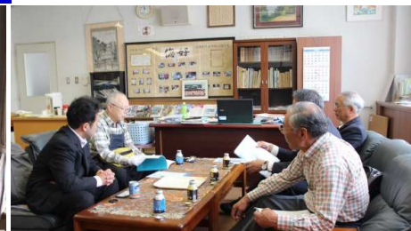
活用について情報交換の様様