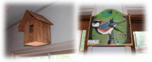
卒業生の残した作品展示(巣箱、時計等)

今年3月完成以降、庄原市から備品(廃校になった小学校の机・イス等)を譲り受け、少しずつ整備してきました。完成当初、殺風景だった部屋が温もりを感じられるように生まれ変わりました。