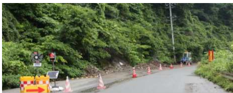
国道183号 別所発電所より登り500m付近 土砂崩れ多数発生 7/12(撮影日)