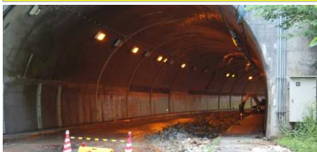
国道314号 土砂の流入した熊野トンネル 7/9