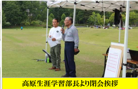
高原生涯学習部長より閉会挨拶