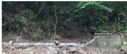
同左国道の上にある破損した水路 7/12