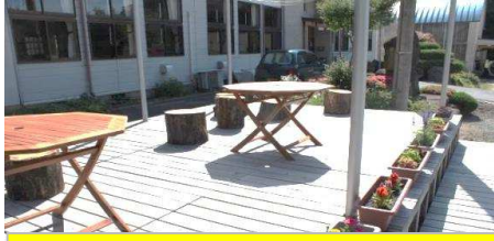
デッキにテーブル、プランターを設置