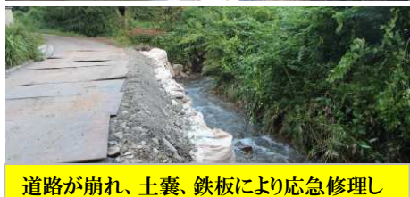
道路が崩れ、土嚢、鉄板により応急修理した奥八鳥 7/9