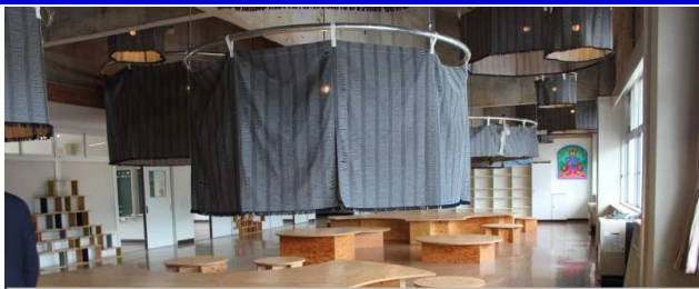
2階の交流スペースへ「和紙デニム」を使ったランプシェード