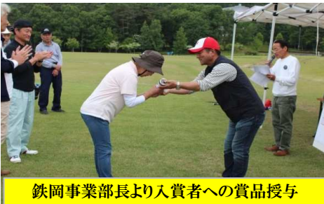
鉄岡事業部長より入賞者への賞品授与