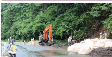
国道314号 JR馬野隧道近くの土砂崩れ 7/9