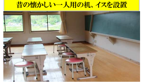
昔の懐かしい一人用の机、イスを設置