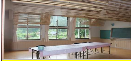
交流スペースへテーブル、イスを設置