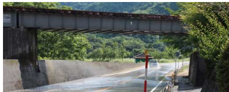
落合橋近く鉄橋下の冠水した国道183号 7/9