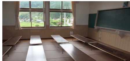
畳の部屋に設置した机