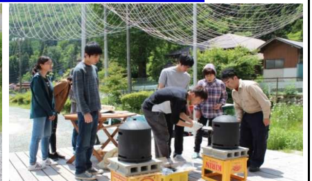
曾利マネージャーが焼き加減をチェック